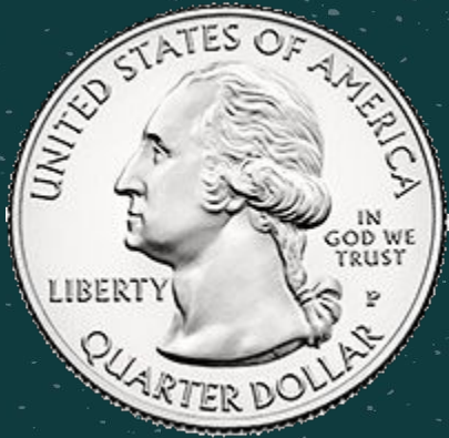
Quarter 25 ¢

Can you identify the money below. ¿Puedes identificar la moneda debajo?